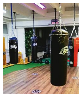
Gute Trainingsmöglichkeit für die Boxabteilung.

Seit November 2021 trainieren die Boxer:innen in einem gut ausgestatteten Kursraum des „Le Studio“ in der Boschstraße 5 in Puchheim. Hier kann ein abwechslungsreiches und spezifisch abgestimmtes Box-