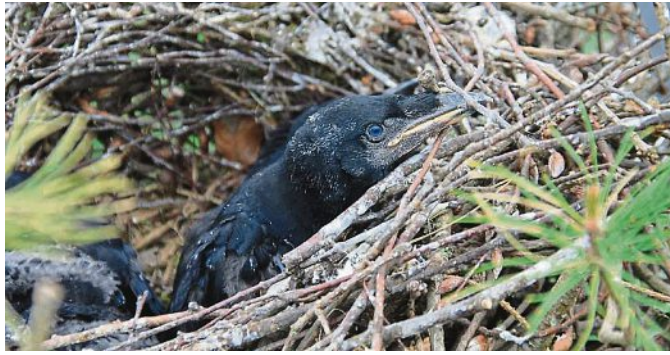
Die Brutstätten der Saatkrähen sind fast nur noch innerhalb von Städten und Gemeinden zu finden.

In Puchheim wurde im Jahr 2008 eine Saatkrähenbrutkolonie im Schopflachfriedhof