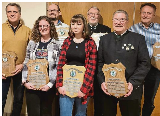
Die Vereins- und Jahresmeister von Eintracht Puchheim.