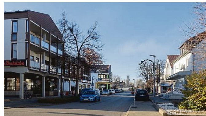
Die Lochhauser Straße in Blickrichtung Bahnhof.

Sollte eine erneute Verschiebung erforderlich sein, wird dies auf der Website der Stadt bekanntgegeben. Fragen oder Kommentare zum Projekt können Sie gerne an die Projekt-E-Mail-Adresse puchheim@dragomir.de richten.