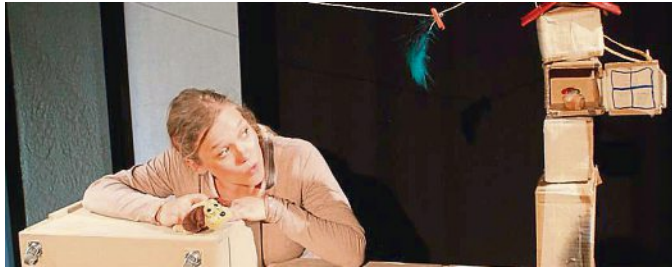
Das Figurentheater Eigentlich tritt im Kinderprogramm auf.

Veranstalter: Stadt Puchheim PUC, Béla Bartók-Saal Normalpreis 26,20 Euro; ermäßigt 22,90 Euro