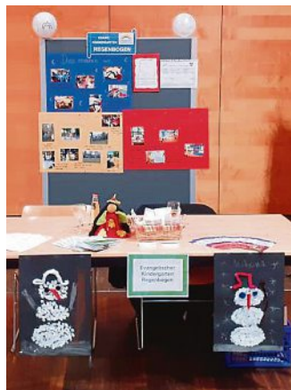
Die Informationsmesse der Kindertagesstätten im PUC war gut besucht.